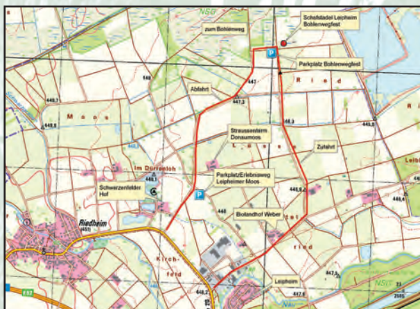
Zu- und Abfahrt zum Bohlenwegfesdchle (s. rote Linie)

Die MitarbeiterInnen der ARGE Donaumoos und das Blaue-Ente-Team freuen sich auf Ihr Kommen.